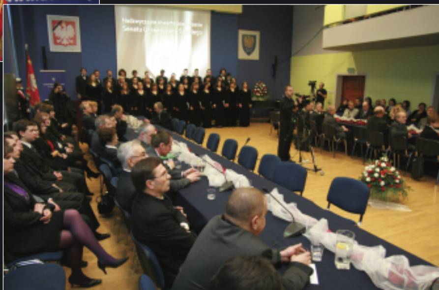
Nadzwyczajne, otwarte posiedzenie Senatu UŚ odbyło się w auli im. K. Lepszego w rektoracie UŚ