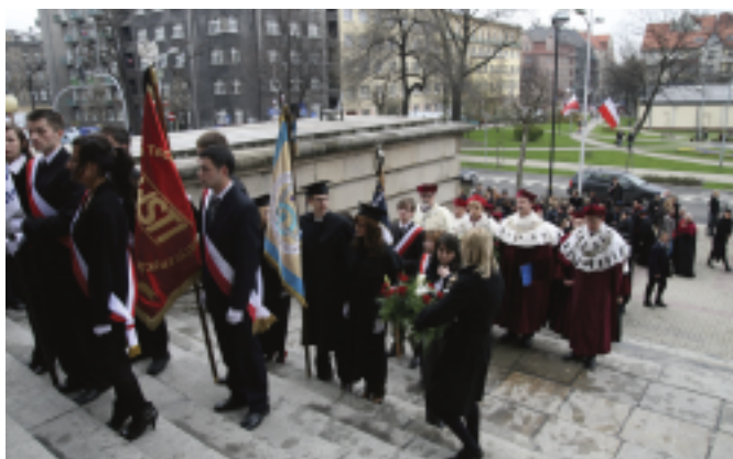
Msza akademicka w intencji Ofiar katastrofy pod Smoleńskiem odbyła się w Archikatedrze Chrystusa Króla w Katowicach