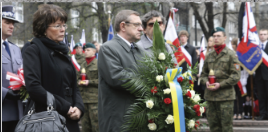
Pomnik Ofiar Katyńskich w Katowicach