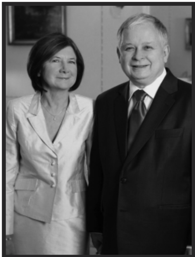
Maria Kaczyńska i Lech Kaczyński - Prezydent RP