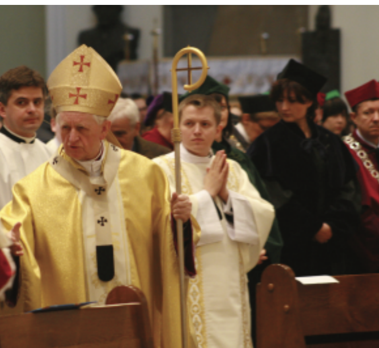
Samian Zimoń, metropolita katowicki