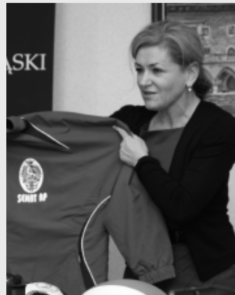
28 września 2008 roku w rektoracie UŚ odbyła się konferencja prasowa przed meczem piłkarskim „Senat kontra Senat”. Wicemarszałek Senatu RP Krystyna Bochenek zaprezentowała koszulki drużyny