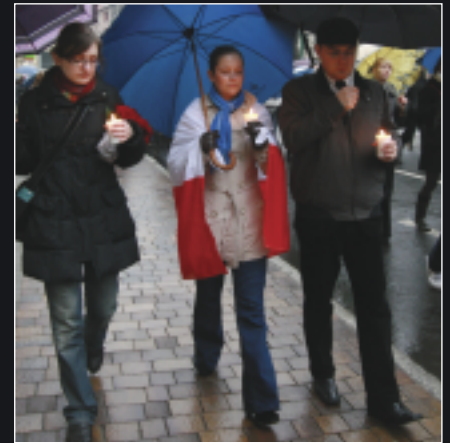
Studenci złożyli kwiaty i znicze pod biurem tragicznie zmarłej wicemarszałek Senatu RP Krystyny Bochenek