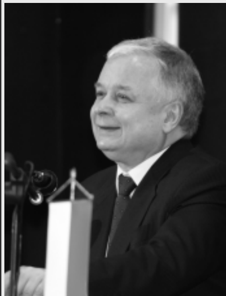
Spotkanie społeczności Uniwersytetu Śląskiego z Prezydentem RP Lechem Kaczyńskim 4 marca 2009 roku