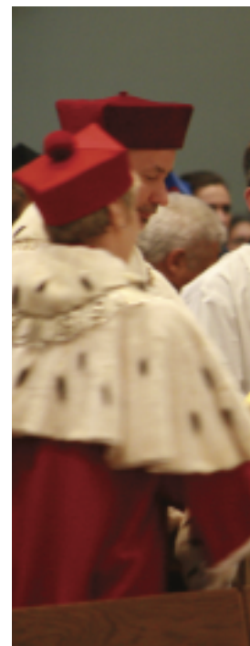
Mszę celebrował JE abp dr D