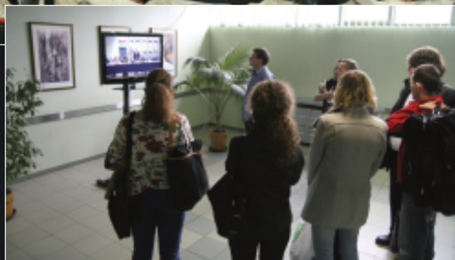
Posiedzenie Senatu UŚ transmitowane było na zewnątrz sali oraz poprzez internet