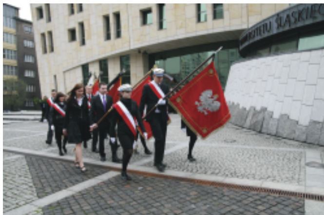
Mszę poprzedził przemarsz orszaków uczelni województwa śląskiego