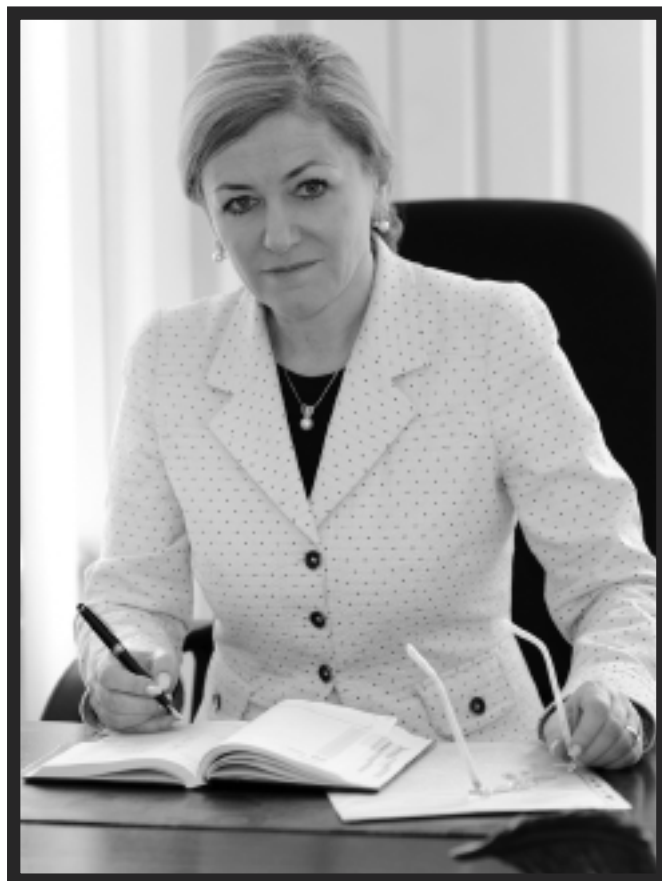
Krystyna Bochenek, wicemarszałek Senatu RP, absolwentka Uniwersytetu Śląskiego w Katowicach

10 kwietnia 2010 r. na lotnisku w Smoleńsku, podczas podchodzenia do lądowania, doszło do katastrofy samolotu Tupolew 154M, w którym znajdowało się 96 osób - członków polskiej delegacji udającej się na obchody 70. rocznicy zbrodni katyńskiej oraz załoga. Na jego pokładzie był Prezydent Polski Lech Kaczyński z małżonką Marią Kaczyńską, ostatni Prezydent RP na Uchodźctwie Ryszard Kaczorowski, wszyscy szefowie sił zbrojnych polskiej armii, duchowni, posłowie, senatorowie, kombatancki oraz przedstawiciele rodzin katyńskich. Nikt nie przeżył katastrofy. W Polsce ogłoszono tygodniową żałobę narodową, społeczność akademicka Uniwersytetu Śląskiego godnie w niej uczestniczyła.