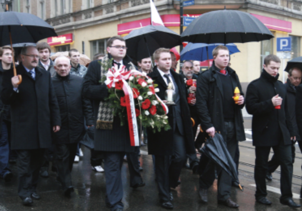
Studencki Marsz Pamięci rozpoczął się na placu Sejmu Śląskiego w Katowicach, pod gmachem Wydziału Filologicznego. Udział w nim wzięli studenci wielu uczelni Śląska i Zagłębia